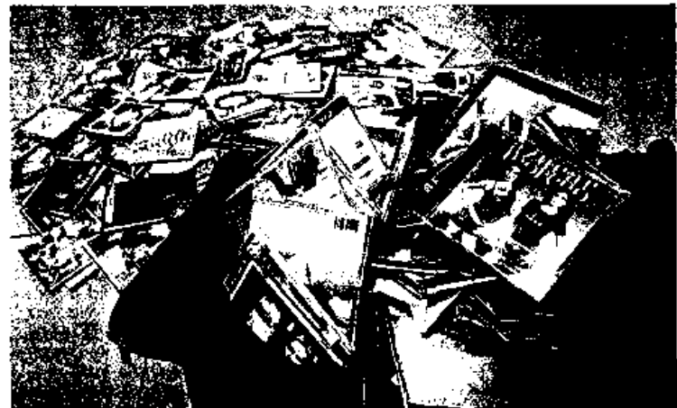
El «top manta» levantó la alerta sobre el fenómeno de la piratería

el pato. No hace mucho, entidades como la Sociedad General de Autores y Editores (SGAE) consiguieron implantar un canon sobre los CD vírgenes argumentando que así se luchaba contra la piratería y el «top manta», a pesar de que ese soporte puede utilizarse para almacenar información no sujeta a derechos de autor. La SGAE anunció recientemente que estudia un nuevo canon para los discos duros de los ordenadores, a lo que ya han expresado su oposición diversas entidades.