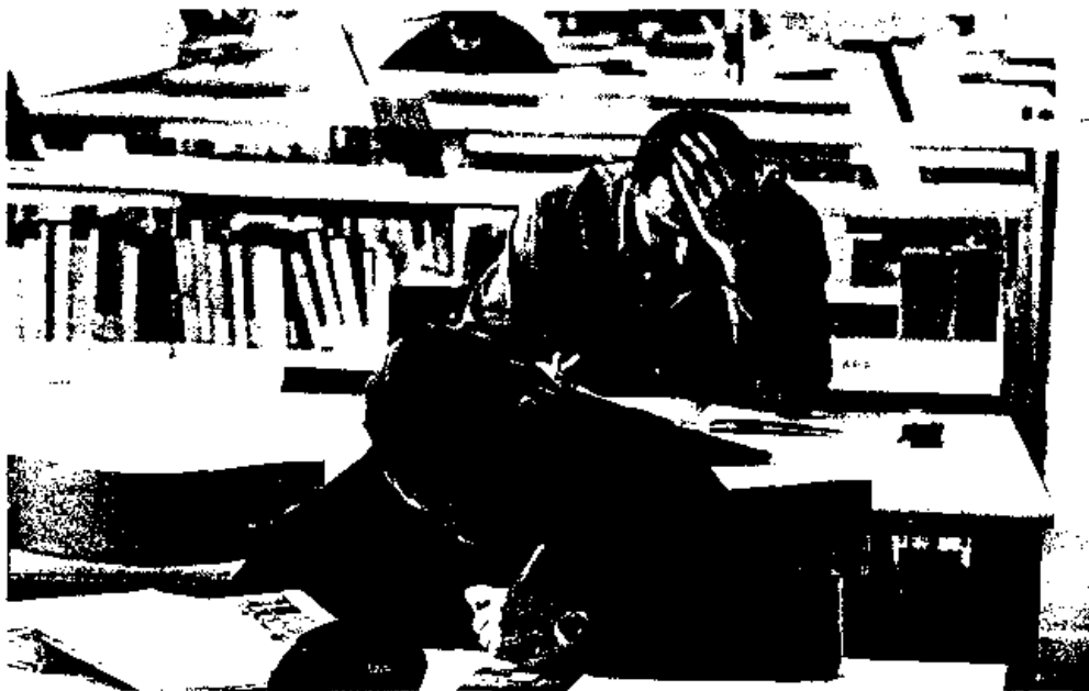
La Biblioteca Central de Terrassa (BCT) es la más visitada de Catalunya