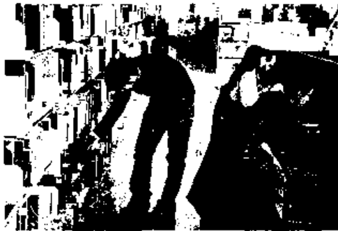
La biblioteca del campus de Terrassa

Sin embargo, la población residente en España ha au-